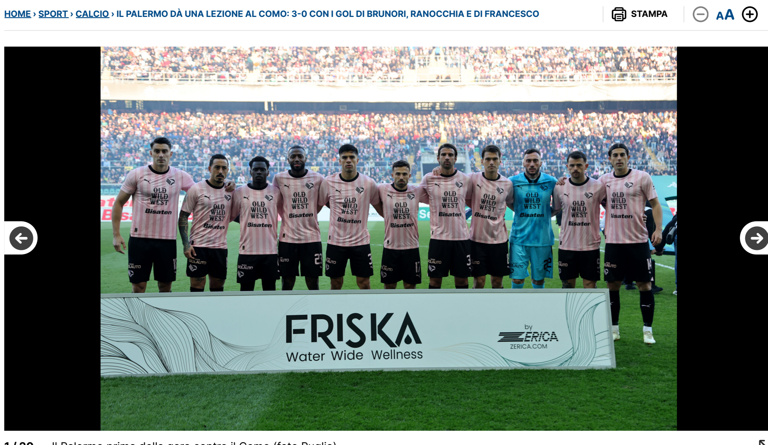
1/20 Il Palermo prima della gara contro il Como