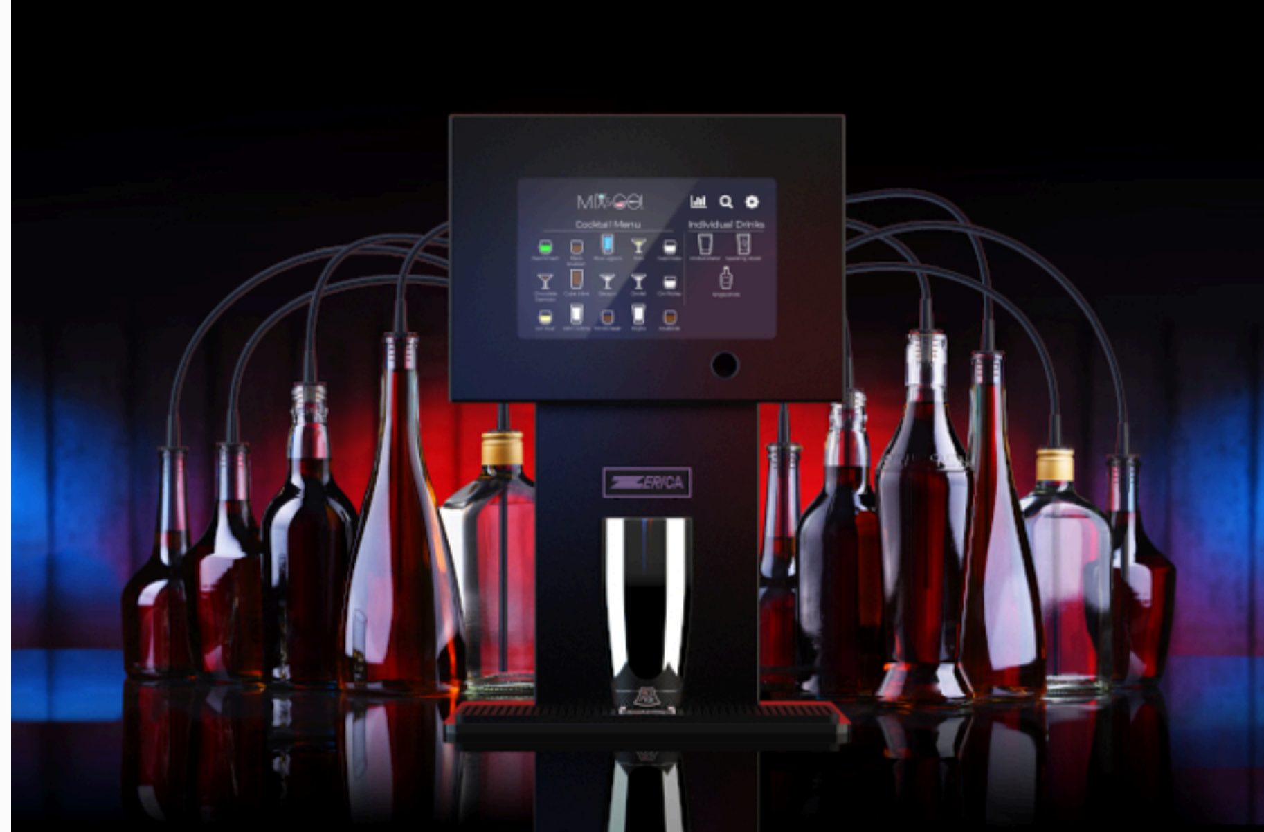
Composition with bottles of assorted alcoholic beverages.

Este producto está disponible en dos versiones: una Élite, dedicada al sector doméstico con 8 líneas + 2 para agua fría y con gas, y una PRO, dedicada al mundo de la hostelería con nada menos que 16 líneas + 2 para agua fría y con gas, y que destaca por su combinación de potencia y eficacia.