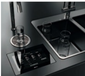
Il water dispenser di Zeric premiato con il Red Dot Award.

Per il secondo anno consecutivo, il brand italiano è vincitore del Red Dot Award 2022 nelle categorie Design e Smart Product con il prodotto Smart-Top.