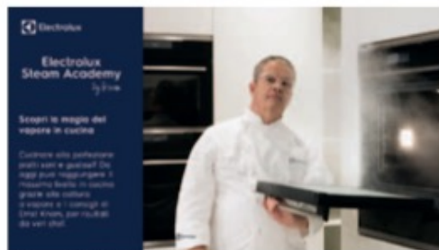
Ernst Knam, uno dei migliori maître chocolatier in Italia.

Il brand svedese, per questa Academy, ha messo a disposizione un'ampia gamma di forni a vapore adatti a ogni esigenza, perfetti per creare piatti incredibilmente sani e gustosi come soffici panificati, morbidi arrostiti e verdure saporite. Piani cottura e la particolare Plancha Grill di Electrolux, per esempio, che può essere utilizzata su qualsiasi fonte di calore e con il nuovo fondo in acciaio inox, e assicura una distribuzione della temperatura uniforme.